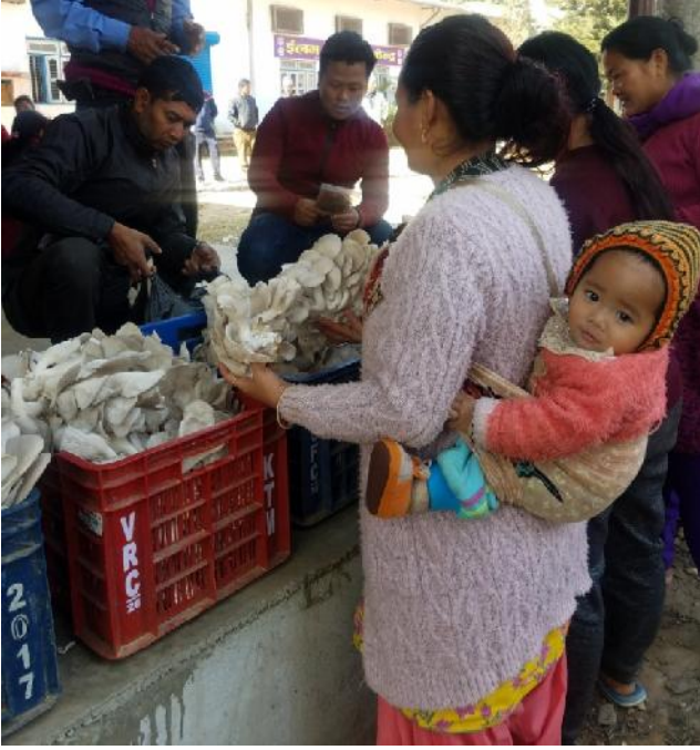
नवनिर्मित हाट बजारमा आफ्नो उत्पादन विक्री गर्दै एक कृषक

काम गरिरहेका छौं । यस बजारको स्थायित्वका लागि दिशानिर्देश गर्न निर्देशिकाको मस्यौदा भैसकेको छ । हामी धेरै आशावादी छौं कि सुआहाराले प्रवर्धन गरेका ग्रामिण नमूना कृषकहरू बजार व्यवस्थापन समितिमा रहनु भएकोले केही दिशानिर्देश गर्ने छ । यसबाट उत्पादकहरू र उपभोक्तहरूले प्रत्यक्ष लाभ लिन सक्नुहुनेछ।”