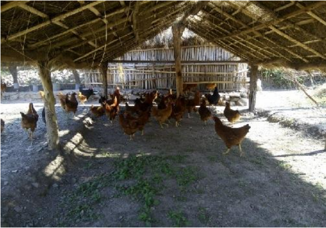
कुखुराको चरणका लागि बनाइएको ठाउँ ।

उनको काममा घरपरिवारका सबै सदस्यले सघाउँछन् भन्ने उनको भनाई छ । गतवर्ष सिजनमा उनले खुर्सानी, टमाटर, भाजि र लसुन गरेर रु. १,४०,०००- बराबरको विक्री गरेको बताइन् । हाल उनको बारीमा १,५०० बोट टमाटर र १५० बोट खुर्सानीका बिरुवा छन् । उत्पादित गरेको कृषिउपजहरु नजिकै कैलाली जिल्लाको सिमानामा रहेको शान्तिपुर संकलन केन्द्रमा विक्रि गर्ने गरेको उनी बताउँछिन् । त्यही आम्दानीबाट कुखुरा खरिद गरेको र खोर समेत बनाएको उनी बताउँछिन् । उनको कुखुरा पालन प्रतिको लगाव देखेर जोरायल गाउँपालिका पशु सेवा शाखाले अण्डामा आत्मनिर्भर कार्यक्रम अन्तर्गत ४० वटा उन्नत जातका कुखुरा दिएको छ । अहिले उनीसँग ६० कुखुरा छन् । कुखुरालाई खुवाउने जुकाको औषधि घरमै लिएर राख्ने गरेकी छन् । औषधि ३/३ महिनामा खुवाउने गर्ने गरेको उनले बताइन् । कुखुरालाई आवश्यक पर्ने दाना केही बजारबाट ल्याउने गरेको र बाँकी घरमै पोषिलो दाना बनाउने गरेको पनि उनले बताइन् ।